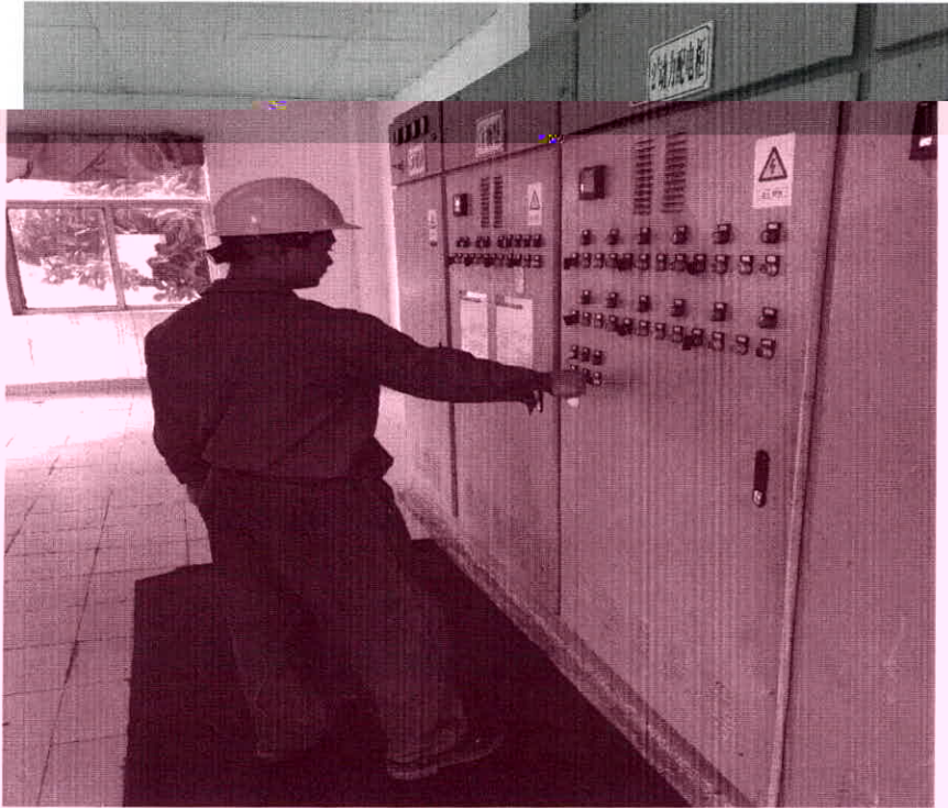
机修人员调整提升泵功率