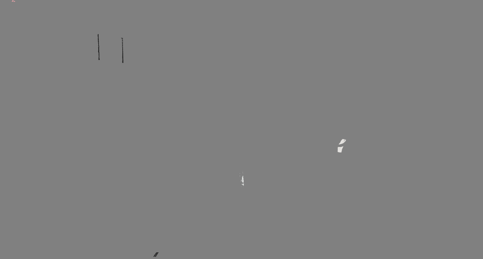
图 3：厂内应急方案桌面演练