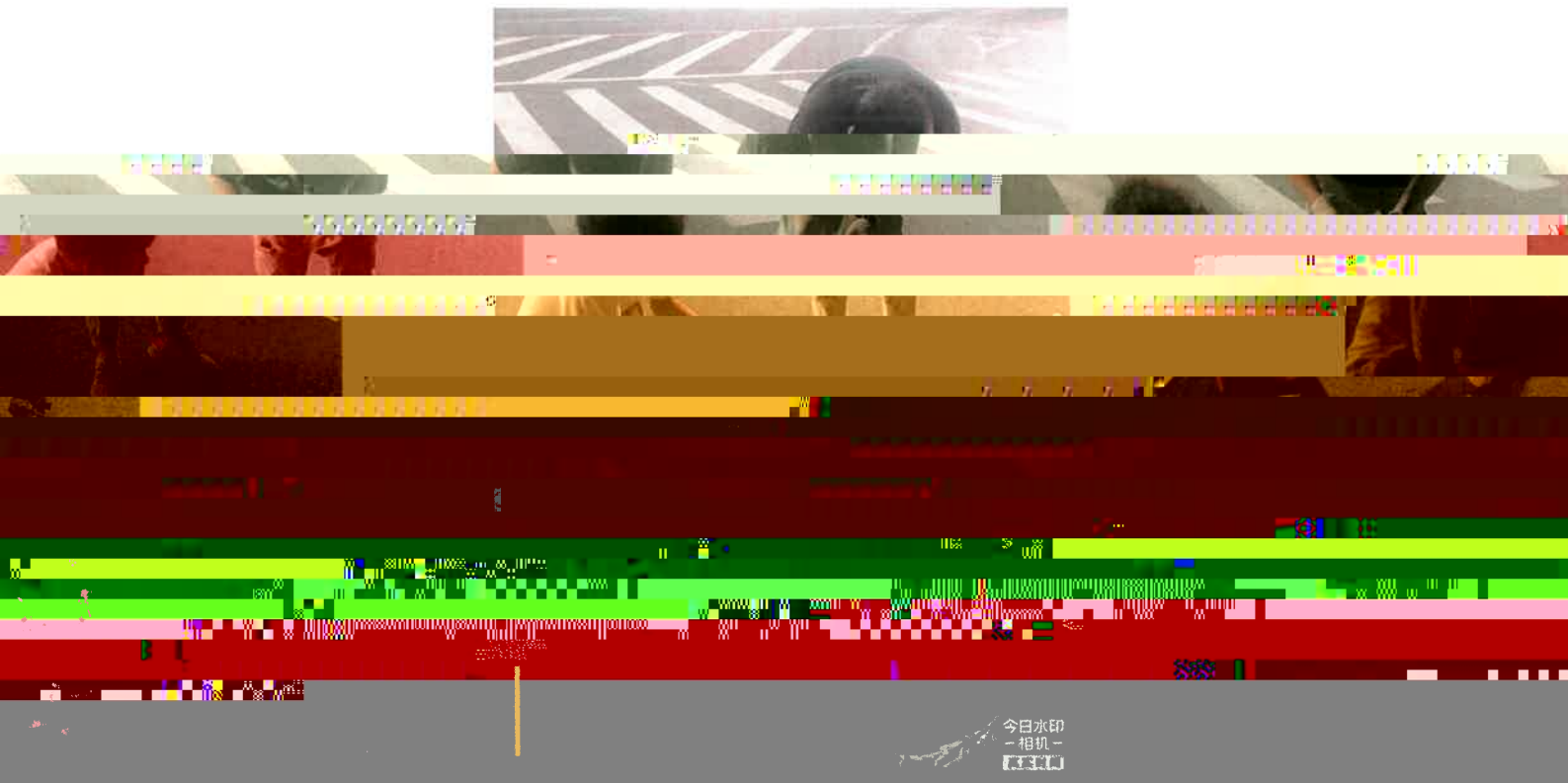
图 2：外部管网排查采样